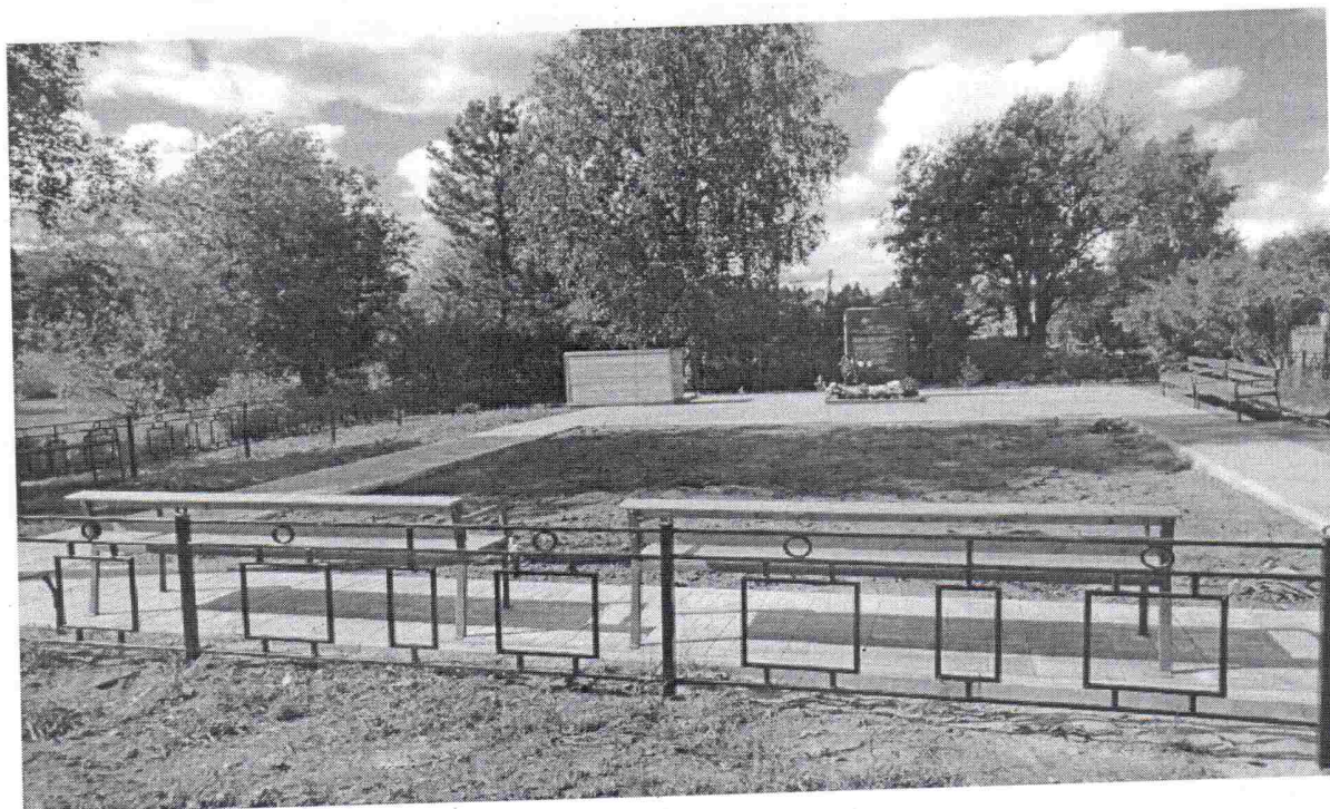
Общественная территория после ремонта